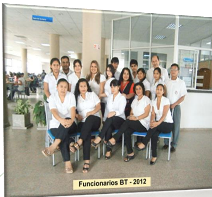
Funcionarios BT - 2012